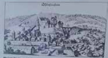
Merian Stich von 1643

Vergleicht man den Merian-Kupferstich mit dem heutigen Erscheinungsbild von Weißenstein, so stellt man fest, dass die grundlegenden Strukturen mehr wie vor vorhanden sind. Vorher der Verlauf über den Grundriss der Stadt, die linke Schwankmauer zwischen Stadt und Schloss, das Schloss und der e-förmige Verlauf der Straße, heute die B 446.