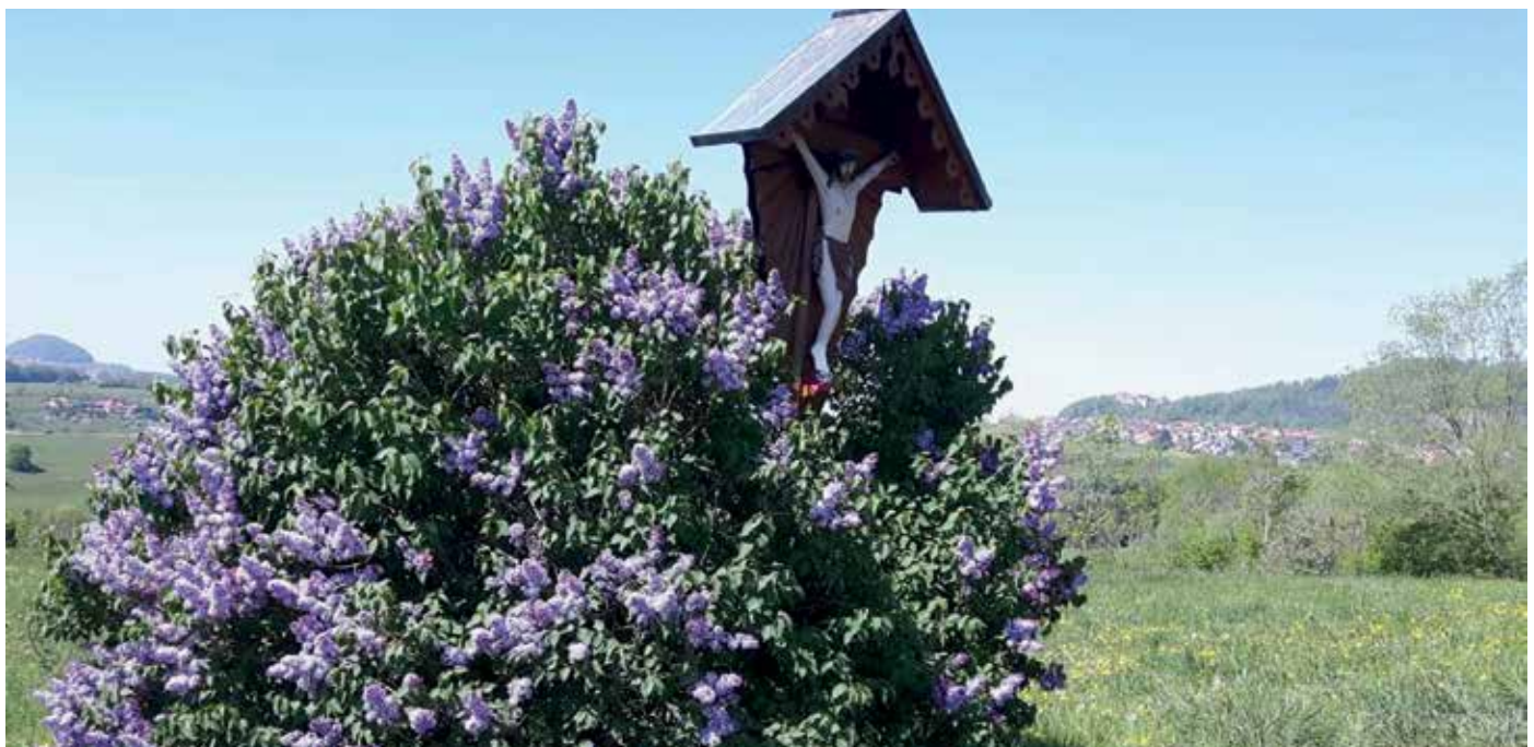
Wanderung oberhalb Wißgoldingen - mit Blick auf Hohenstaufen + Rechberg