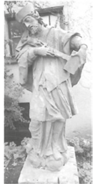
Abb. 2: Gesamtaufnahme im Endzustand