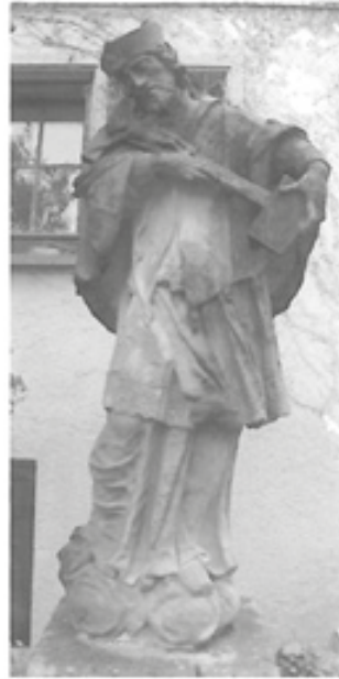
Abb. 1: Gesamtaufnahme im Vorzustand