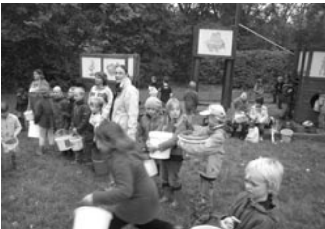
Kinder an der Apfelwaage