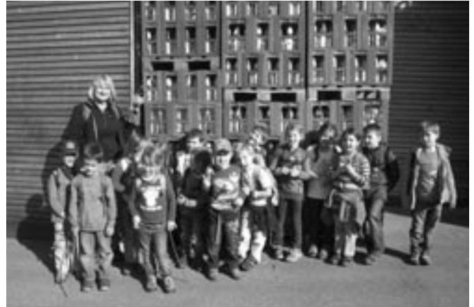
Klasse 1 bei Auer

Süßer Apfelmost von Äpfeln aus unserer Heimat schmeckt lecker!