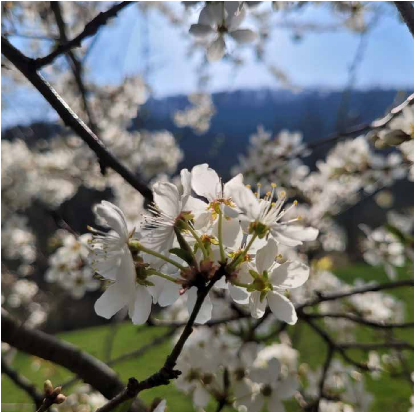
Blütenbaum im Christental