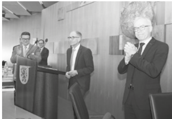
Landrat Edgar Wolff freut sich über seine Wiederwahl am 07.04. im Göppingen Kreistag.

wählt. 62 von 63 Kreisrätinnen und Kreisräten waren anwesend und nahmen an der Wahl teil. Der 58-jährige Diplom-Verwaltungswirt (FH) Edgar Wolff steht seit dem 1. Juli 2009 an der Spitze der Landkreisverwaltung.