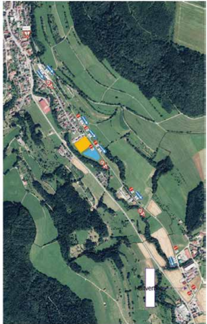
Blaue Markierung = Parkplatz 1 Orangefarbene Markierung = Festzelt