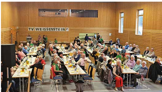
Bild-Impressionen vom Senioren-Nachmittag 2025